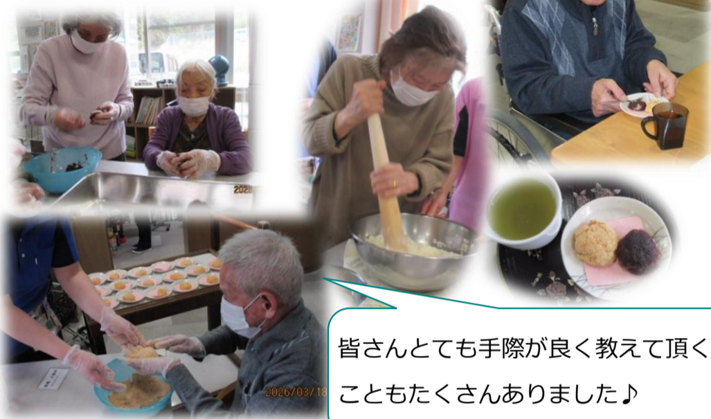
皆さんとても手際が良く教えて頂くこともたくさんありました♪

栄養部では美味しく愛情のこもった食事を毎日作っています。皆さんの「美味しいね」の言葉がとても励みになっています♪