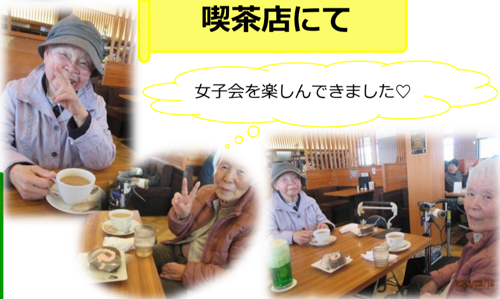
女子会を楽しんできました♡

～皆様へのお願い～ 物価高騰を受け、これまで通年で提供していた午後の体操後のスポーツ飲料の提供を夏期のみとさせて頂くこととなりました。ご理解ご協力のほどよろしくお願い致します。