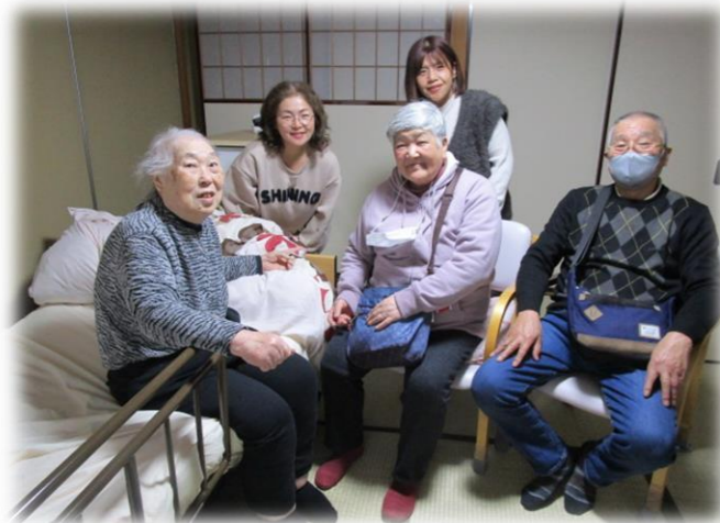
遠方から会いに来てくださいました。皆様、笑顔での久しぶりの再会。本当にありがとうございます。