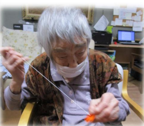
千羽鶴を作ってくださいています。仕上がりが楽しみですですね。