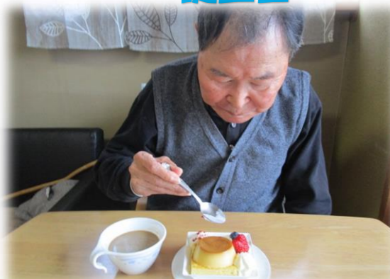
バレンタインチョコもいただきました。毎年ありがとうございます。